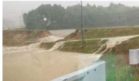
写真2 H25. 7. 28豪雨による決壊 (山口県)