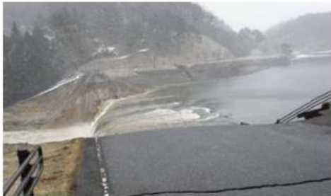
写真1 東北地方太平洋沖地震による決壊 (福島県)

多くのため池の管理は、水利組合や集落などの受益者を主体とした組織によって管理されてきましたが、農家戸数の減少や土地利用の変化から 管理及び監視体制の脆弱化が懸念 されています。